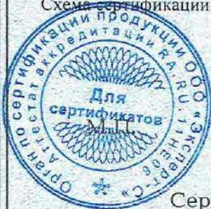
Схема сертификации: Ic